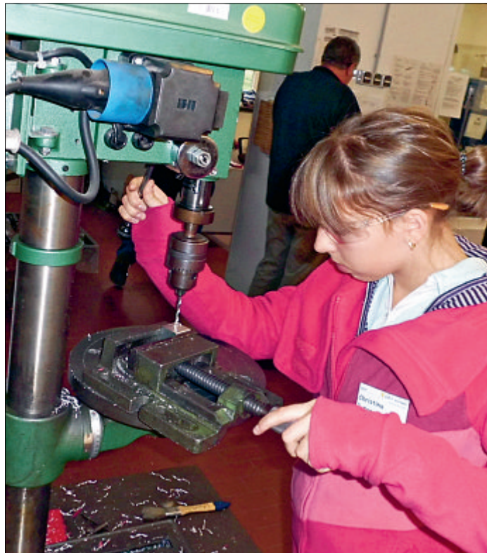
Handwerk ist nicht nur etwas für Jungs, wie die Mädchen während der Berufsorientierung herausgefunden haben.