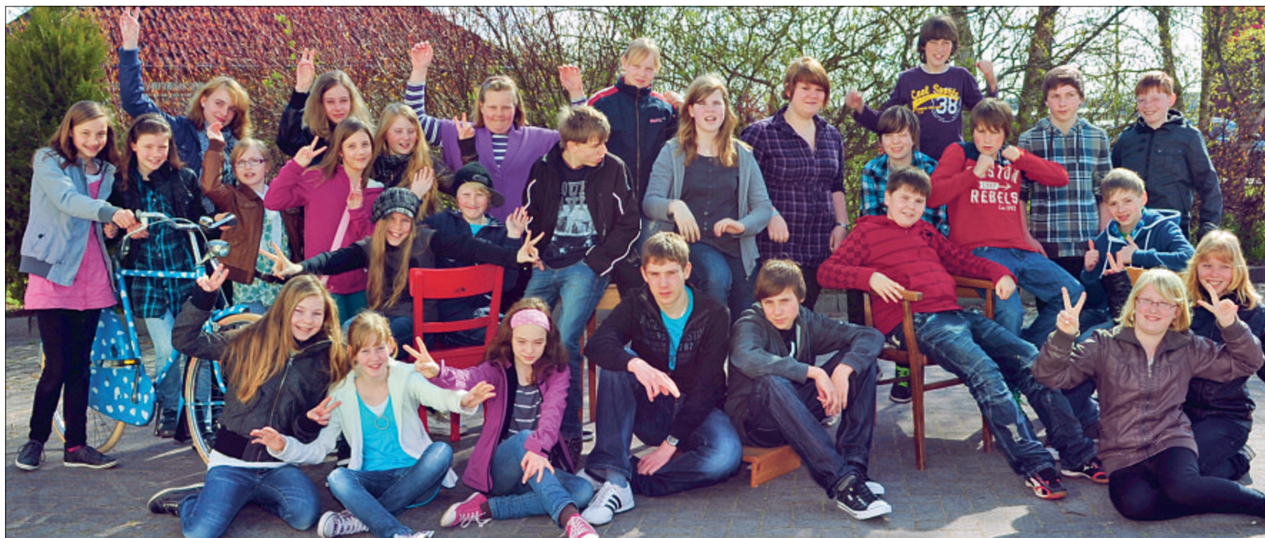
Knapp 30 Schülerinnen und Schüler haben den Mitarbeitern von SKN gestern bei ihrem Tagewerk über die Schulter geschaut.