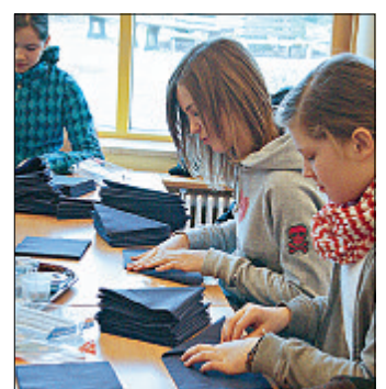
Servietten falten und Tischdecken für 160 Schüler aus Jahrgangsstufe 7.