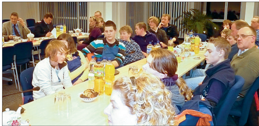
Der große Sitzungssaal des Hager Rathauses bot kürzlich ein eher ungewohntes Bild. Dort, wo sonst die Politiker tagen, kam der Feuerwehrynachwuchs zusammen.

Mit Freude blickt die Hager Jugendfeuerwehr auf das Kreisjugendfeuerwehrlager in den Sommerferien in Dornum, bei dem etwa 900 Jugendliche aus dem Landkreis Aurich teilnehmen werden.