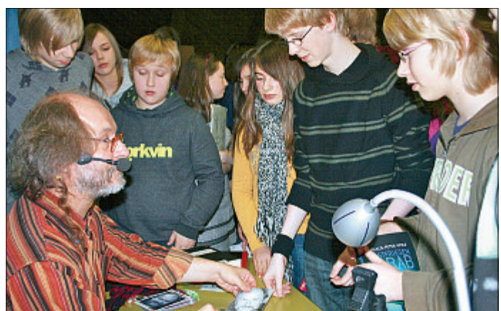
Signierstunde: Schriftsteller Klaus-Peter Wolf erzählte aus seinem Alltag als Autor von Krimis oder Fernsehdrehbüchern.