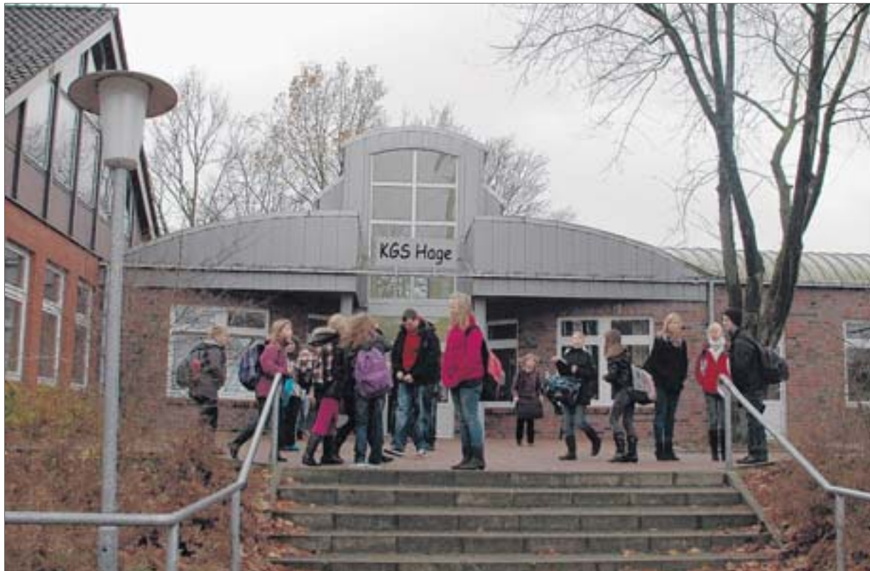
Derzeit müssen die Schüler der KGS nach Klasse 10 die Schule wechseln. Nach der Einrichtung einer gymnasialen Oberstufe wäre das nicht mehr nötig.

Konkreter will Trännapp derzeit noch nicht auf die Planung eingehen. Er hielte es für unglücklich, wenn die Politik aus der Zeitung von dem Konzept erfahren würden. Der Ergebnis soll aber in den nächsten Wochen öffentlich vorgestellt werden. Lang-