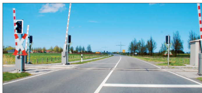
Seit 2009 entsteht beim Überfahren des Bahnübergangs ein lautes Klacken. Viele Anwohner fühlen sich durch den Lärm um den Schlaf gebracht. Das Bauteil soll nun ausgetauscht werden, falls die Landeseisenbahnaufsicht zustimmt.

Wie er sagte, seien seit dem Auftauchen der Beschwerden von Anwohnern verschiedene Maßnahmen probiert worden, den Lärm zu reduzieren. „Das alles hat nicht den gewünschten Effekt gebracht“, wies