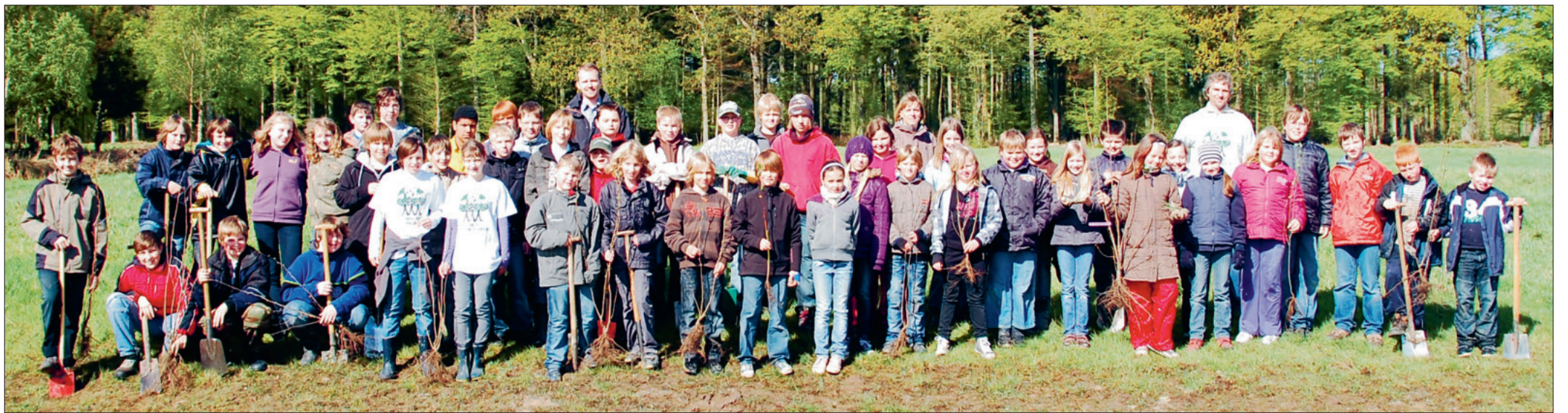
Aktiv für die Umwelt – die Schülerinnen und Schüler der KGS-Klasse 6d und der Klasse 4a der Grundschule pflanzten gestern 220 junge Bäume auf der Wiese östlich der Nordholzsiedlung.