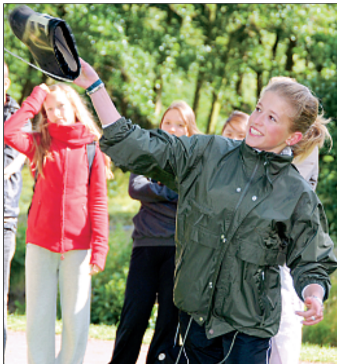
Gekannt. Zum Ostfriesischen Mehrkampf gehörte auch der Gummistiefelweitwurf.