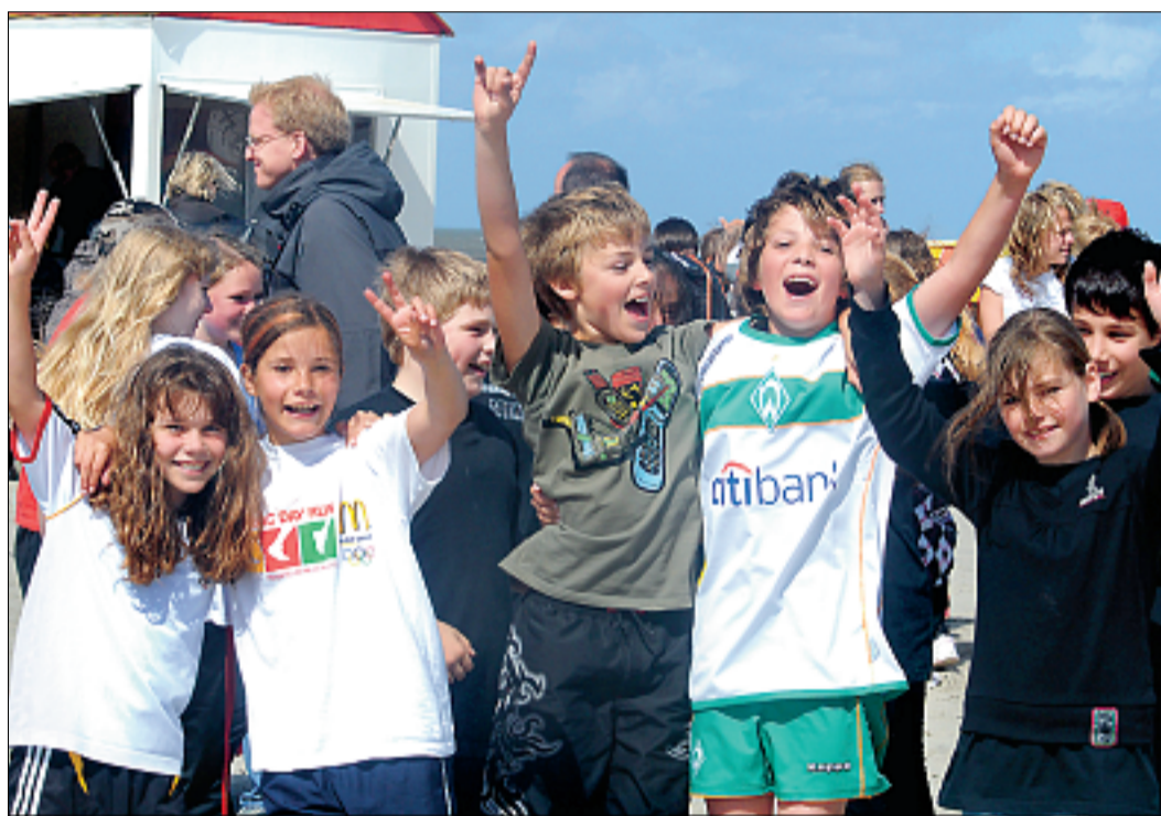
Jubel pur. Kurz vor den Sommerferien erlebten die Jungen und Mädchen noch einmal einen ereignisreichen Schulspottag in Norddeich.