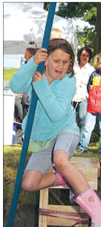
Respekt. Das Pullstockspringen war nicht allen geheuer.