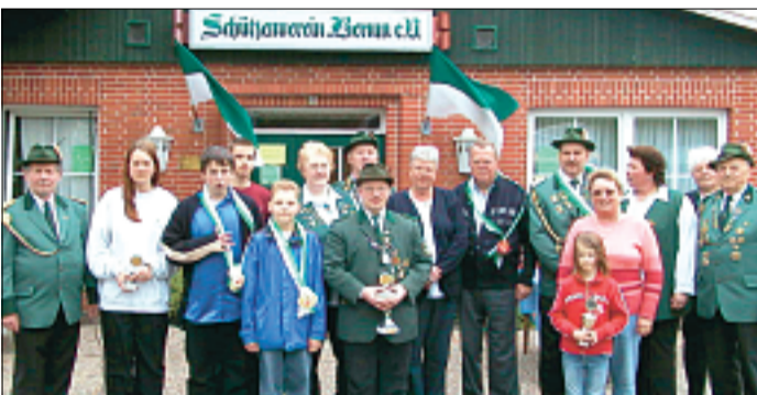
Wer löst das Königshaus der Berumer Schützen ab? In der nächsten Woche gibt es darauf die Antwort.