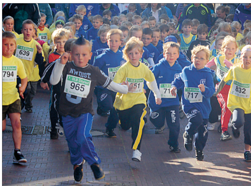
Gemeinsam Kilometer sammeln. Kleine und große Läufer sind morgen von 9 bis 17 Uhr beim Samsung-Charity-Lauf zugunsten des Kindergartens Hollander Weg gefordert.