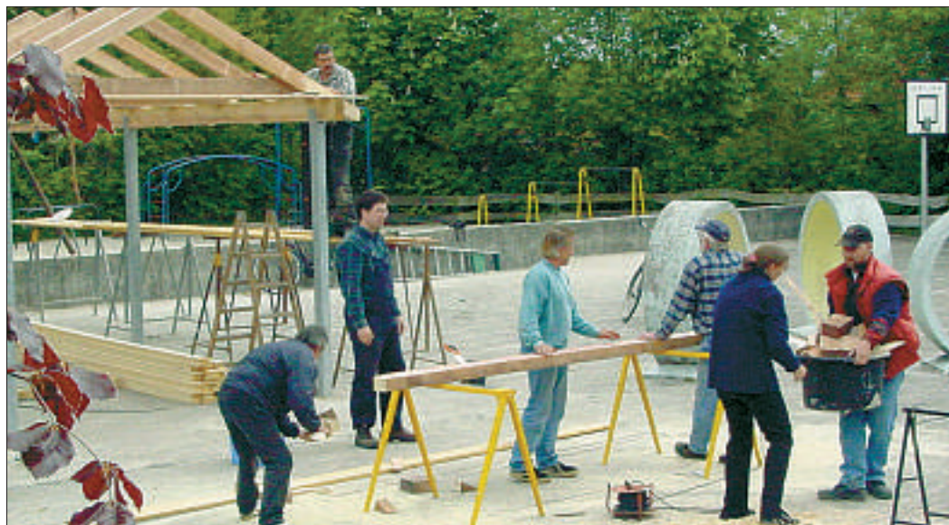
Bei der Schulhofumgestaltung haben Eltern, Schüler und Lehrer kräftig mit angepackt.

Neben den materiellen seien durch die Arbeit des Fördervereins aber auch ideelle Vorteile für Schüler und Eltern entstanden, betonte die Vorsitzende. So wurde die Grundschule im letzten Jahr von Werder Bre-